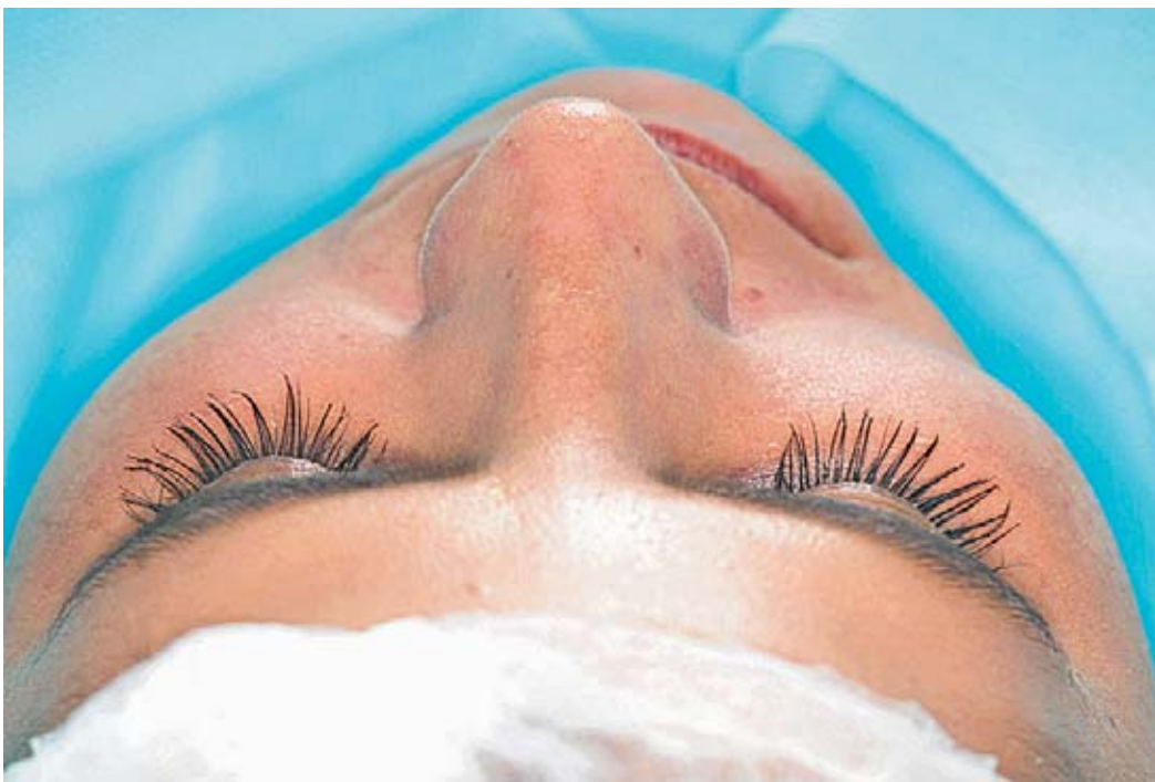
Conhecida popularmente como a lipo do rosto, a intervenção ganha cada vez mais adeptos