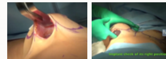
Cirurgias no Hospital Albert Einstein Unidade Perdizes